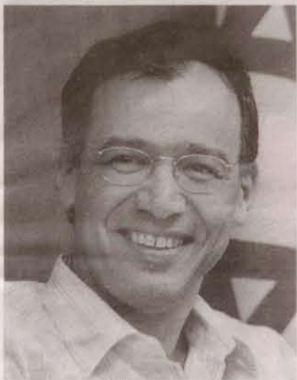
ניצן. בעיה עם חומרים פליליים