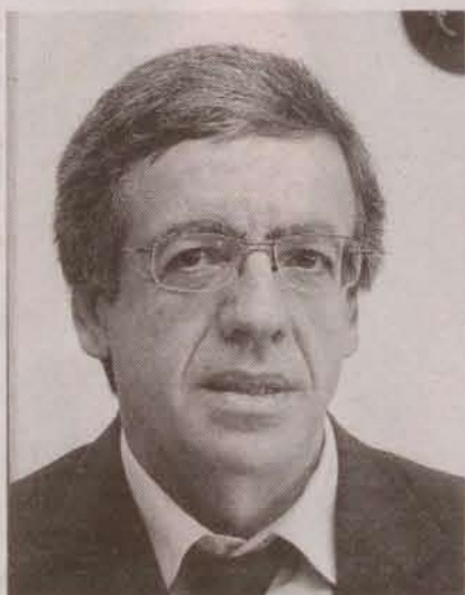
מזו. "מה הוא היה צריך את זה"