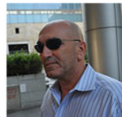
ניצב בר-לב, יום גורלי