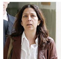
באומהורן. "נוכיח את חפותו"