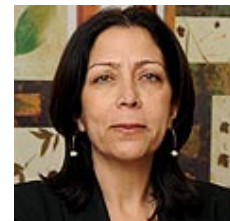
עו"ד באומהורן. עדיף שיקום

אחת השאלות המהותיות שעמדו במשפט היא שאלת כשירותה של לייטנר לעמוד לדין. בית משפט השלום קבע בפעם הקודמת כי היא כשירה, וגזר עליה עונש מאסר בפועל ופיצוי בסך 243 אלף שקלים למתלוננים. במהלך המשפט הובאו פסיכיאטרים מטעם הפסיכיאטר המחוזי, שקבעו כי לייטנר אינה כשירה, אך עמדתם נדחתה לטובת זו של הפסיכיאטרים מטעם הפרקליטות התקבלה.